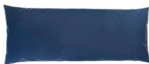
Cojín de soporte grande