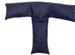
Cojín en forma de T