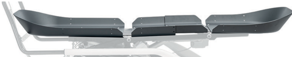
Sistema para lechos posturales