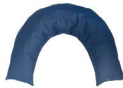
Cojín media luna