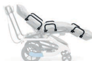
Protección contra caídas para T2 i T3