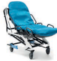
Tina con ruedas traseras de 16" y de dirección de 8" Tina con 4 ruedas giratorias