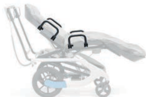
Protección contra caídas para T1