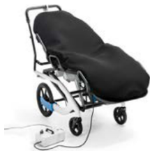
Colchón de vacío