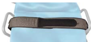
Cinturón de seguridad ancho