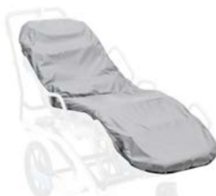
Colchón de apoyo