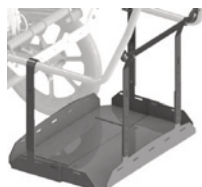
Bandeja para dispositivos médicos en barra empuje