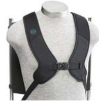
Arnés diámico en H PivotFit

CONSULTA NUESTRA AMPLIA GAMA DE FIJACIONES BODYPOINT