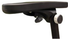
Reposabrazos: incluye inserción para mesa terapéutica de madera