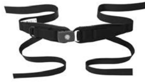
Cinturón pélvico de 4 puntos Bodypoint