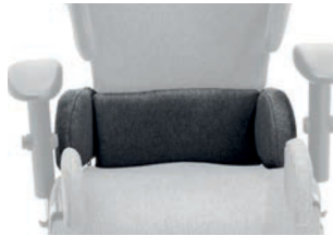
Soporte pélvico ajustable