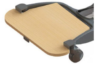
Plataforma de reposapiés extraíble