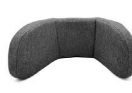
Reposacabezas con guías laterales ajustables