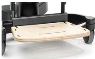
Reposapiés regulable en altura, ángulo y plegable