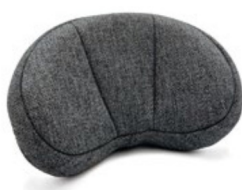
Reposacabezas en forma de concha