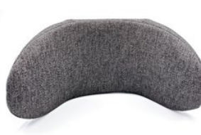
Reposacabezas con guías laterales