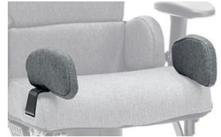
Soportes laterales de cadera