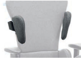
Soportes laterales de tronco