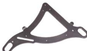
Kit de anclaje para vehículo