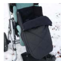
Saco para invierno