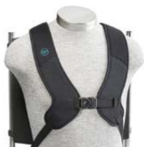
Arnés dinámico en H PivotFit