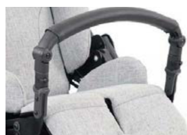
Barra delantera con funda