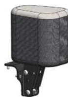
Taco abductor, fijo