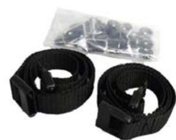
Cincha para piés