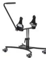
Chasis de interior Basic