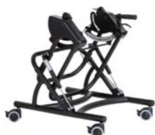
Chasis de interior Cobra