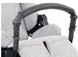
Barra delantera con funda