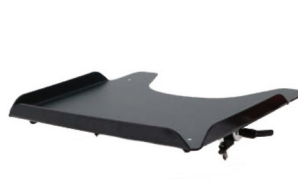
Mesa terapéutica gris, altura ajustable