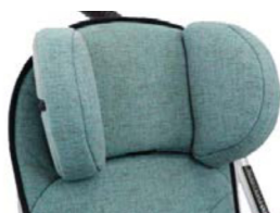
Soportes para la cabeza