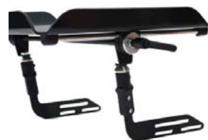
Soporte para barra delantera o mesa terapéutica