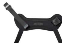
Cincha de tobillo Ankle Huggers