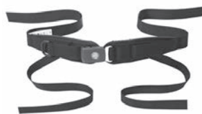
Cinturón pélvico de 4 puntos Bodypoint