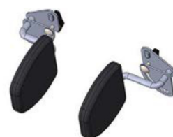
Soportes de tronco ajustables