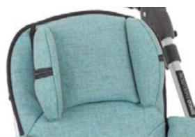
Soportes para la cabeza delgados