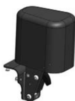
Taco abductor, extraíble y abatible