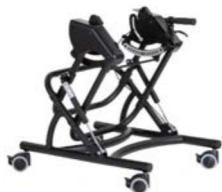
Chasis de interior Cobra