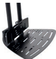
Placa de talón de aluminio