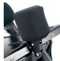
Taco abductor fijo