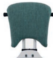
Respaldo largo: parte superior y cojín