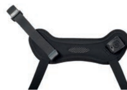
Cincha de tobillo Ankle Huggers