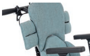
Guía superior del brazo