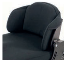
Cojín para base de respaldo con almohadillas de cadera ajustables