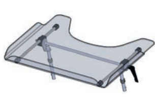
Mesa de terapia transparente