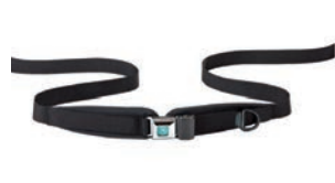
Cinturón pélvico de 2 puntos Bodypoint