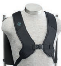
Arnés dinámico en H PivotFit