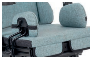
Soportes para muslos