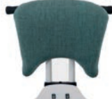
Respaldo mediano: parte superior y cojín