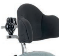
Reposacabezas con soporte de montaje