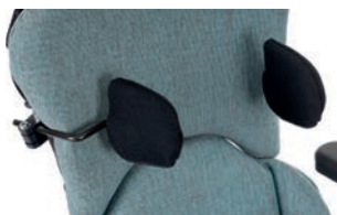
Soporte de tronco multidireccional