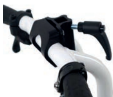
Soporte universal para reposacabezas asimétrico