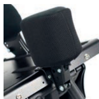
Taco abductor abatible y extraíble