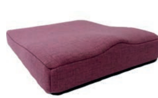
Cojín de asiento Contorneado