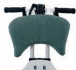
Respaldo corto: parte superior y cojín