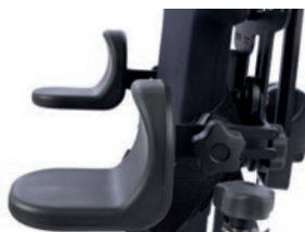
Soporte brazo con tope codo