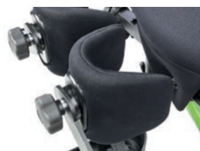
Tamaño del soporte de rodilla de 11 cm