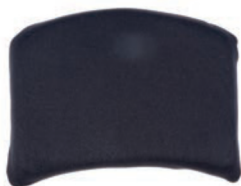
Respaldo plano de 28 cm a 33 cm de altura