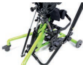
Actuador Hidráulico con mango extraíble