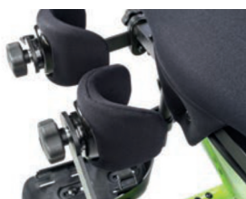
Tamaño del soporte de rodilla de 7 cm