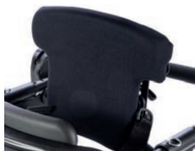
Respaldo plano de 38 cm a 43 cm de altura