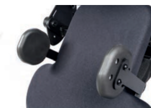
Soportes de cadera