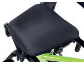
Asiento con ajuste de forma