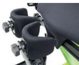
Tamaño del soporte de rodilla de 8,5 cm