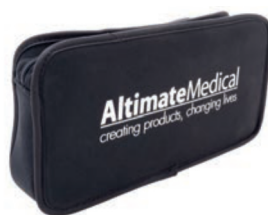
Bolsa de herramientas