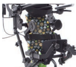
Funda higiénica para asiento plano