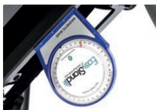
Identificador de ángulo