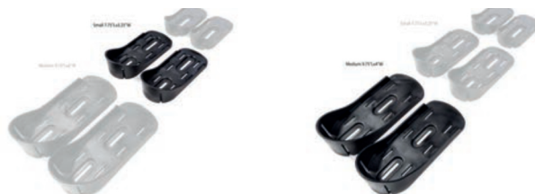
Tamaño del Soporte de pies 19,5 cm L x 8,5 cm A Tamaño del Soporte de pies 24,5 cm L x 10 cm A