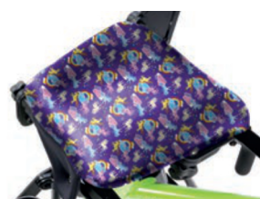
Funda higiénica para asiento con ajuste de forma