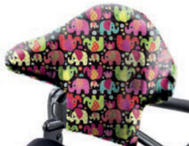
Funda higiénica para respaldo con ajuste de forma de 38 cm a 43 cm de altura *