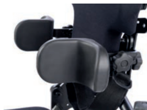
Soportes laterales con tope de codo