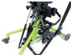
Actuador Hidráulico con mango extraíble