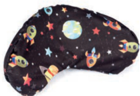
Funda higiénica para reposacabezas