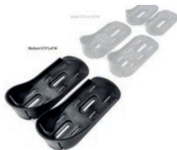
Tamaño del Soporte de pies 24,5 cm L x 10 cm A