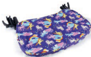
Funda higiénica acolchada