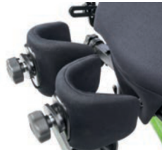
Tamaño del soporte de rodilla de 11 cm