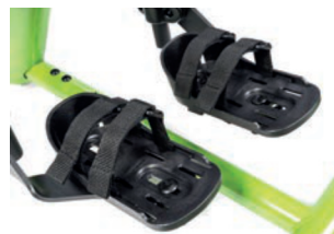
Cinchas de seguridad para soporte de pies 25 cm