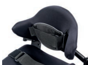
Respaldo con ajuste forma de 28 cm a 33 cm de altura