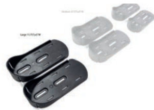
Tamaño del Soporte de pies 29,5 cm L x 13 cm A