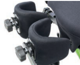
Tamaño del soporte de rodilla de 13 cm