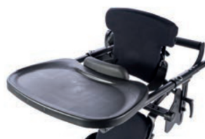
Bandeja moldeada negra 28 cm L x 48 cm A