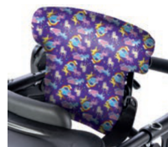
Funda higiénica para respaldo plano de 38 a 43 cm de altura