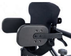
Soportes laterales planos