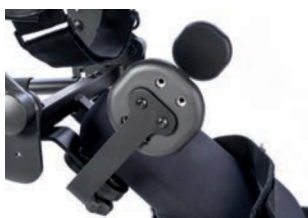
Soportes de cadera