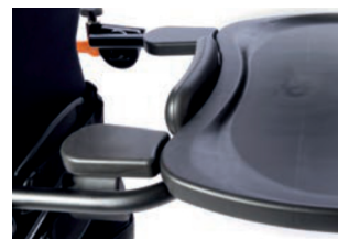
Apoyo de antebrazo para bandeja moldeada negra