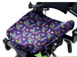
Funda higiénica para asiento con ajuste de forma