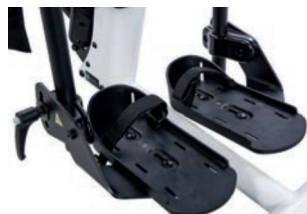
Cinchas para soporte de pies 38 cm L