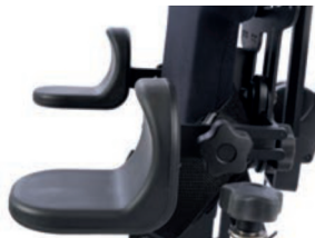
Soporte brazo con tope codo