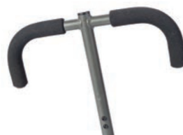
Empuñadura en forma de T