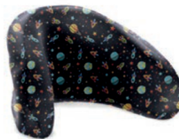
Funda higiénica para reposacabezas con ajuste de forma