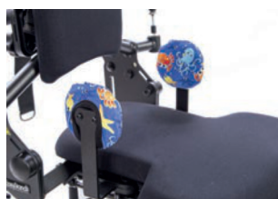
Funda higiénica para soportes de cadera