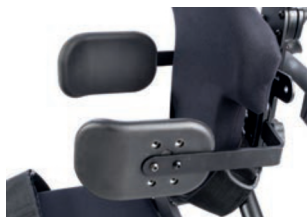
Soportes laterales curvados