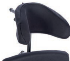
Reposacabezas con ajuste de forma