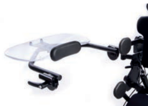
Bandeja transparente abatible