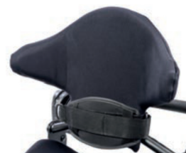
Respaldo con ajuste forma de 38 cm a 43 cm de altura