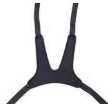
Chaleco pectoral en forma de X