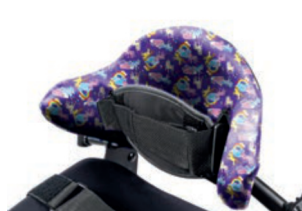
Funda higiénica para respaldo con ajuste de forma de 28 cm a 33 cm de altura *