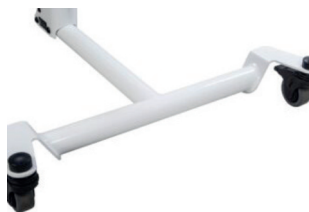
Chasis frontal (ruedas delanteras fijas de 5'')