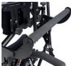
Asas de empuje