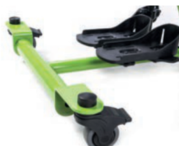
Chasis frontal (ruedas delanteras giratorias de 3'')