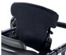
Respaldo plano de 28 cm a 33 cm de altura