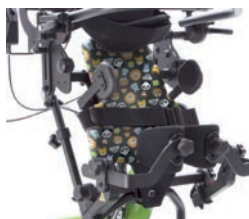
Funda higiénica para asiento plano