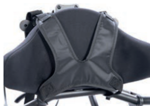
Chaleco pectoral no elástico en forma de X