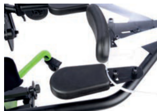
Apoyo de antebrazo para bandeja transparente