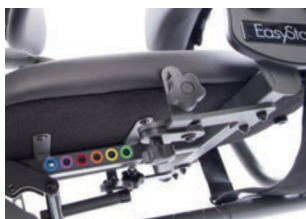
Ajuste fácil de profundidad de asiento