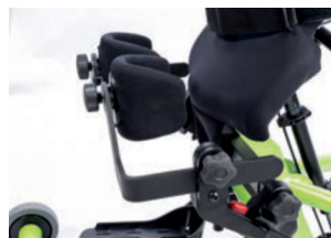
Soportes abatibles de rodilla