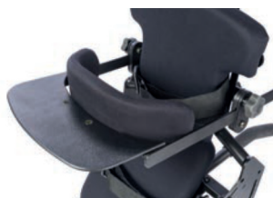
Bandeja para opción móvil