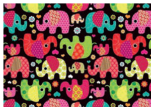
Elefantes con pantalones molones