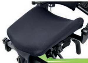
Asiento con ajuste de forma