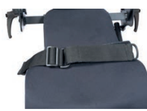
Cinturón posicionador (circunferencia cadera hasta 83 cm)