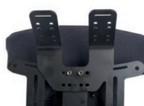
Soporte para montaje alto de chaleco pectoral