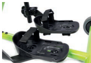
Cinchas para soporte de pies 25 cm L