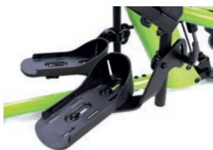
Soporte de pies multi-ajustable