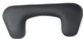
Almohadillado para codo de 23,5 cm