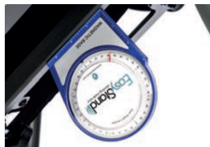
Identificador de ángulo