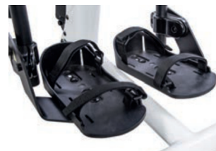
Cinchas de seguridad para soporte de pies 38 cm