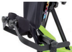
Soportes deslizantes de rodilla