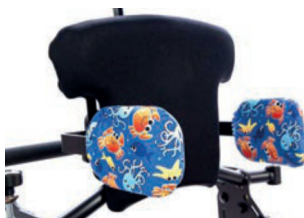
Funda higiénica para soportes laterales