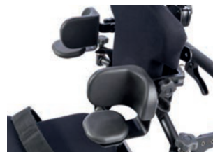
Soportes laterales con tope de codo y soporte de brazo