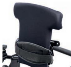
Respaldo plano de 38 cm a 43 cm de altura