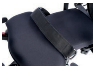
Cinturón posicionador (circunferencia cadera hasta 58 cm)