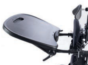
Bandeja moldeada negra 53 cm L x 60 cm A