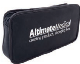
Bolsa de herramientas