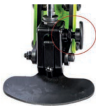
Bloqueo de elevación pistón