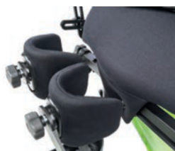
Tamaño del soporte de rodilla de 8,5 cm