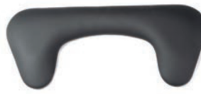
Almohadillado para codo de 28 cm