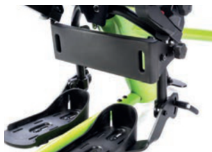
Apoyo de pantorilla