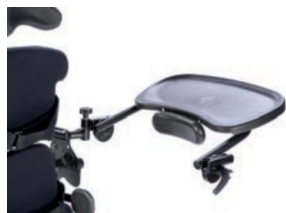
Bandeja moldeada negra abatible