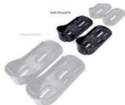
Tamaño del Soporte de pies 19,5 cm L x 8,5 cm A