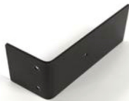
Estabilizador de respaldo