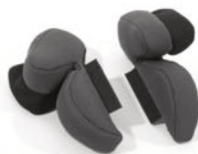
Acolchado de soporte de cadera