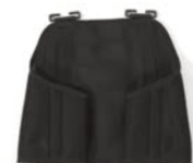
Chaleco de seguridad T1