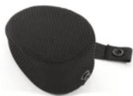
Taco abductor de espuma