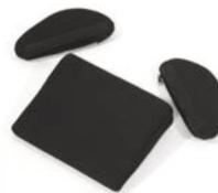
Reductor de asiento