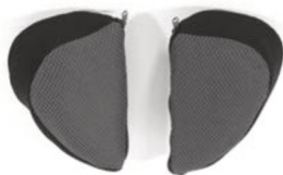
Acolchado de soporte lateral