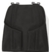
Chaleco de seguridad T2