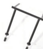
Estabilizador de suelo*