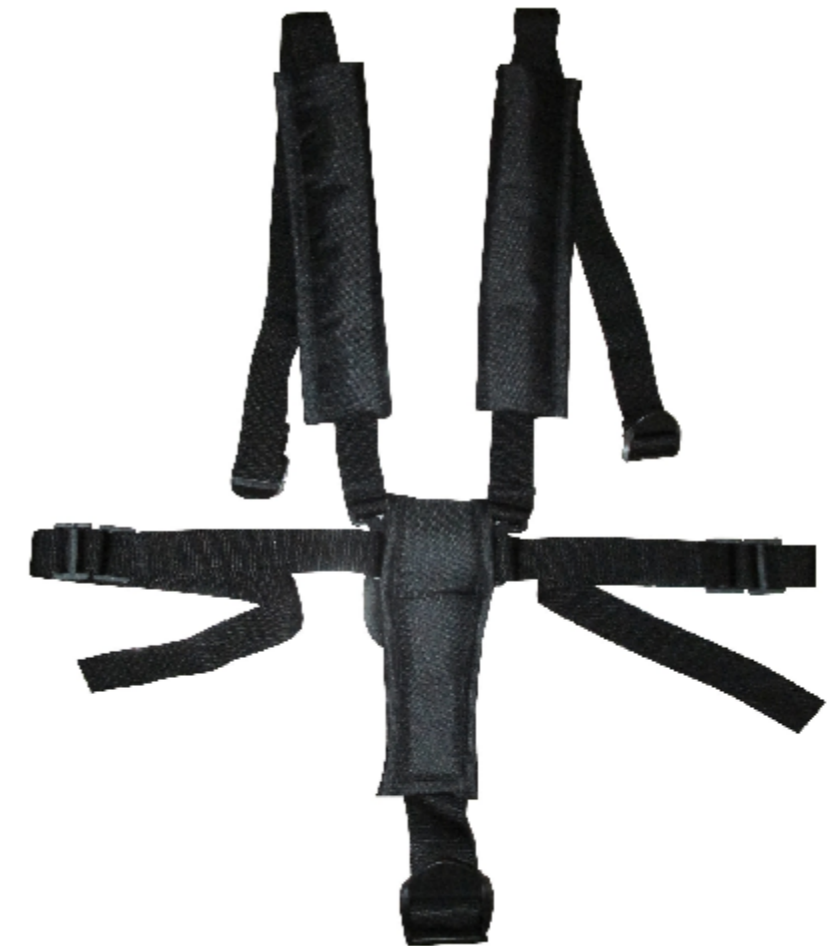
Pos. 3 5-point safety belt