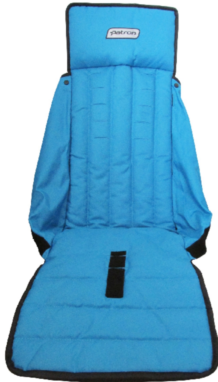
Pos. 1 Upholstery