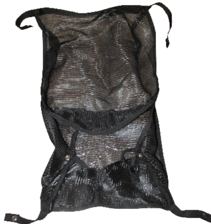
Pos. 2 Basket