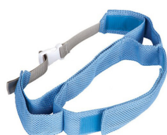
Cinturón de tronco con fijaciones laterales

La talla de los accesorios debe ser la misma que la de la hamaca de baño