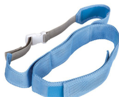
Cinturón de tronco estándar