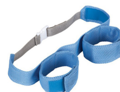
Cinturón de piernas