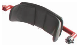
Soporte pélvico detrás de la pelvis