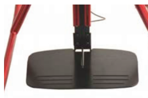
Reposapiés regulables en altura y profundidad