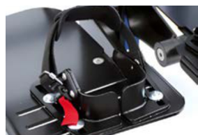
Cuña talón y cinchas de tobillo