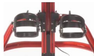
Soporte de rodilla con soportes fijación ajustables