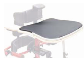
Mesa con cuenco y reposabrazos ajustables