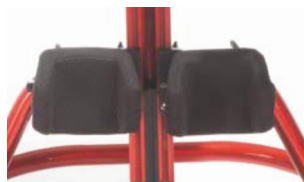
Soportes de rodilla