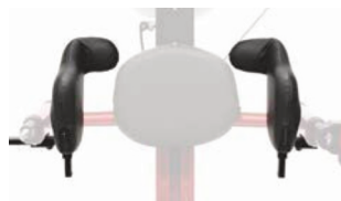
Soporte combinado espalda y pelvis