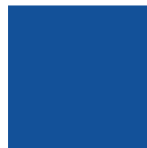
Azul metálico T3