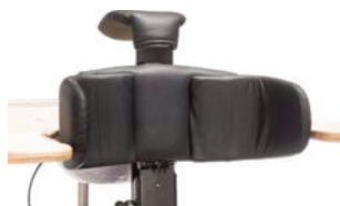
Soporte de pecho ajustable