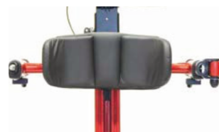
Soporte pélvico delante de la pelvis