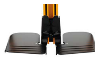
Reposapiés individuales regulables altura, ancho y ángulo