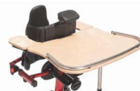
Mesa con reposabrazos ajustables