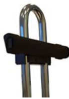
Barra universal para montar fijaciones