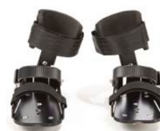
Pedales con soporte dinámico de tobillo