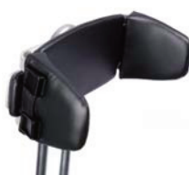
Respaldo ajustable en anchura