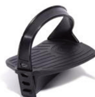
Pedales con fijación