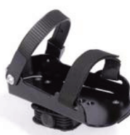
Pedales tipo sandalia