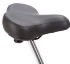
Sillín tipo ciclomotor