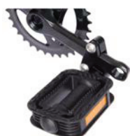
Reductor bielas pedales ajustable