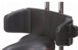
Control pélvico ajustable