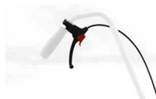
Freno acompañante para barra de empuje