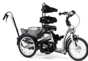
Barra de empuje direccional