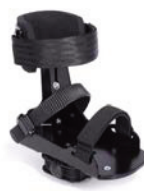
Pedales con soporte de tobillo