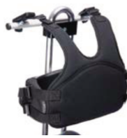
Chaleco de fijación