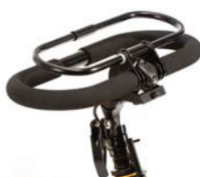
Manillar cerrado con sistema de freno