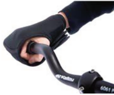
Fijación de mano