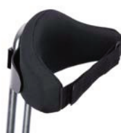
Respaldo dinámico con cinturón