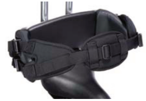
Cinturón de 4 puntos