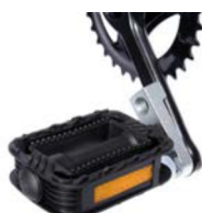
Reductor bielas pedales