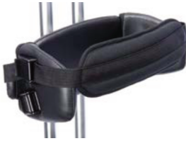
Cinturón de pecho