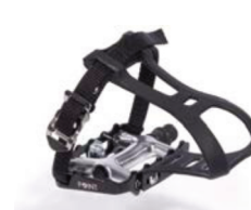
Pedales tipo ciclismo