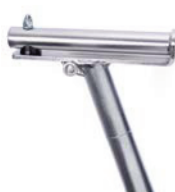
Soporte de sillín en forma de T