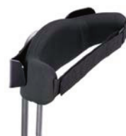
Control pélvico dinámico