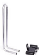
Barra del respaldo