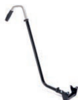
Barra de empuje