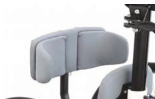
Soporte pélvico detrás de la pelvis