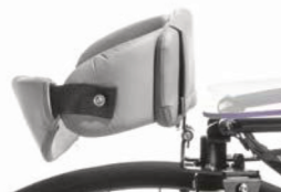
Cincha ancha de soporte de espalda