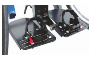
Cuña talón y cinchas de tobillo