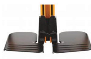
Plataformas de reposapiés ajustables individualmente