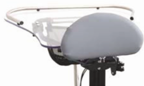
Soporte de pecho ajustable en altura