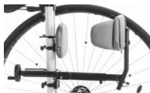
Mecanismo de plegado para soporte de glúteos