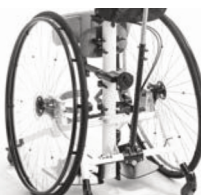
Protector de radios transparente