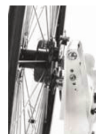
Ajuste inclinación de las ruedas