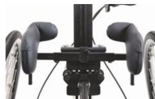
Soporte combinado espalda y pelvis