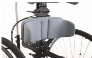
Soporte pélvico delante de la pelvis