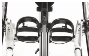
Soporte de rodilla ajustable en 3 dimensiones