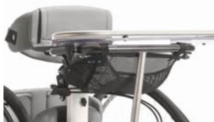
Soporte pectoral con controles laterales, ajustables