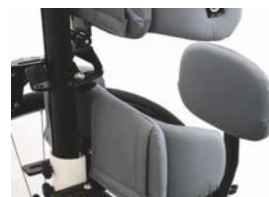
Soporte de glúteos