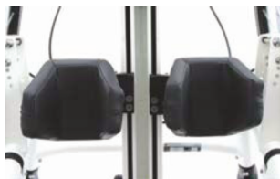
Soporte de rodilla estándar