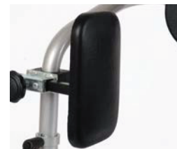
Soportes de cadera