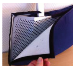
Funda para divisoria de piernas