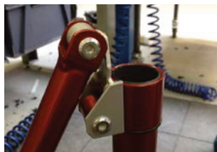
Ajustes de reducción de altura