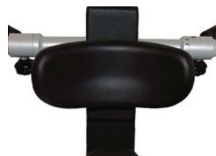
Apoyo de tronco