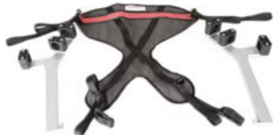
Sustentador pélvico con soportes