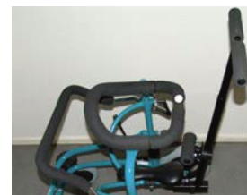
Barra de empuje