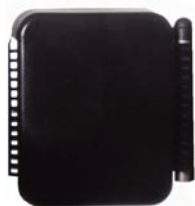
Bloque extra para soporte de tronco