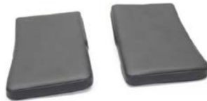
Acolchado para reposapiés individuales con paletas separadas