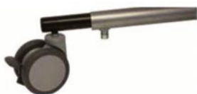
Prolongador de chasis