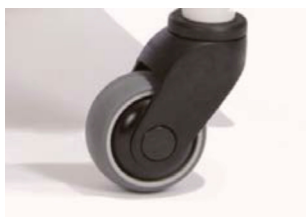
4 ruedas, 2 con bloqueo