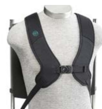
Arnés diámico en H PivotFit