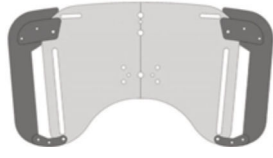
Guía de brazo para respaldo corto / largo