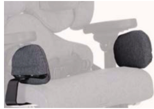
Soportes laterales cadera