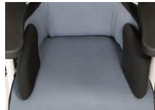
Soporte pélvico ajustable