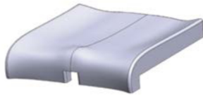
Asiento acolchado estándar