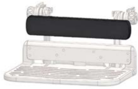
Placa de pantorrilla para plataforma monobloc