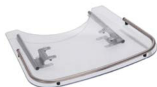
Mesa terapéutica transparente fijada en ambos lados