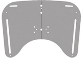
Respaldo corto / largo