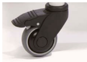
4 ruedas, todas con bloqueo