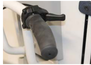
Palanca ajuste basculación montada en empuñaduras