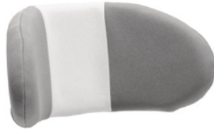
Reposacabezas en forma de U