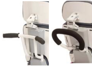
Tubos del respaldo con: 1. empuñaduras (foto izda.) 2. barra empuje (foto dcha.)