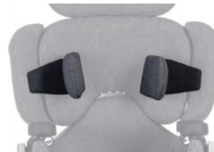
Almohadilla de tórax/pecho