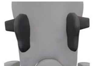
Almohadilla larga de tórax/pecho