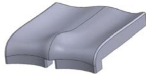
Acolchado anatómico de asiento