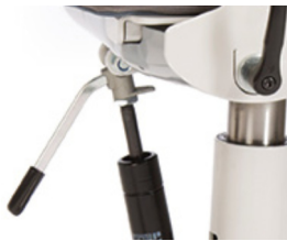
Palanca ajuste basculación montada bajo asiento