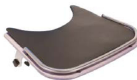
Acolchado para mesa