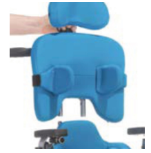
Opción respaldo extraíble con empuñadura