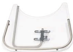
Mesa terapéutica transparente abatible