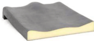
Recubrimiento incontinencia zona asiento