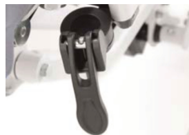
Freno de estacionamiento central