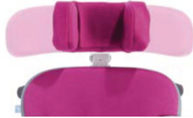
Reposacabezas con guías laterales ajustables