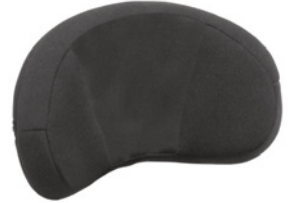
Reposacabezas forma concha