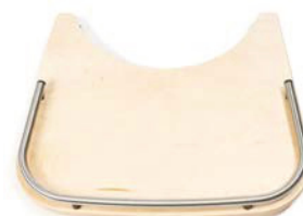
Mesa terapéutica madera fijada en ambos lados