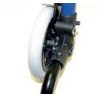
Freno de fricción