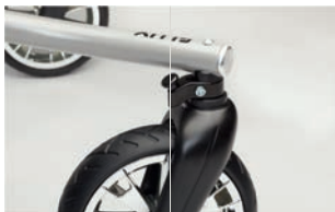
Bloqueo de dirección