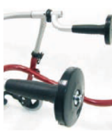
Tope tipo disco para empuñadura