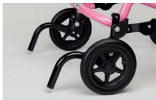
Antivuelcos para talla 1 a 3