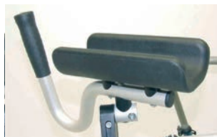
Soportes de antebrazo con empuñadura, 22 x 10,4 cm