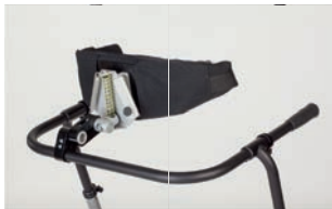
Soporte de control de cadera dinámico