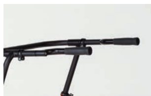
Barra con empuñaduras ajustables en rotación