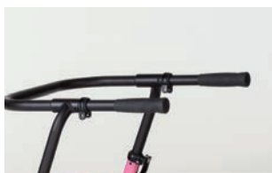
Barra estándar, con empuñadura regulable