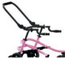
Barra de empuje para asistente