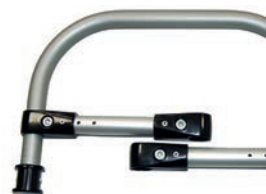
Barra soporte para sustentador pélvico