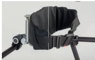
Control de cadera dinámico con cinturón