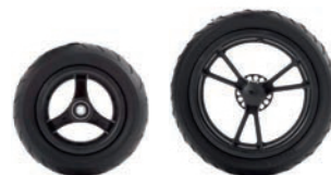
Ruedas PU con llantas de 6 radios