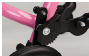
Antiretroceso con más agarre