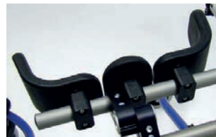
Soporte de cadera ajustable