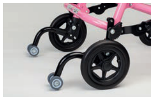
Antivuelcos con ruedas para talla 1 a 3