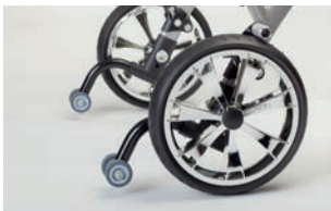
Antivuelcos con ruedas para talla 4