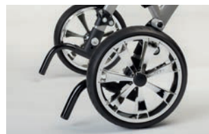
Antivuelcos para talla 4