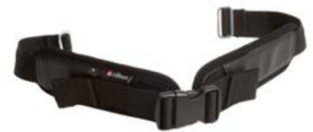
Cinturón de pierna