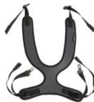
Peto de fijación estrecho