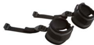
Par de bandas de tobillos