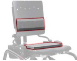
Kit soporte lumbar y asiento