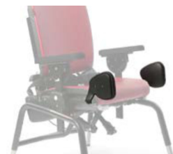
Par de adductores