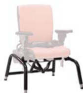
Base con basculación