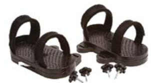
Par de sandalias