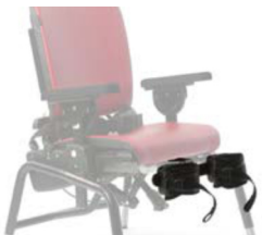
Soporte de piernas