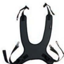
Peto de fijación estándar