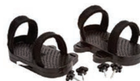
Par de sandalias