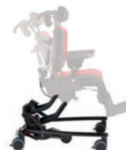
Base Hi-Lo con basculación y ruedas