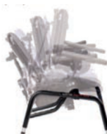
Base con basculación y asiento dinámico