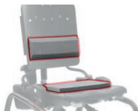
Kit soporte lumbar y asiento