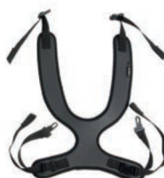
Peto de fijación estrecho