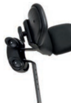
Reposacabezas con alas ajustables