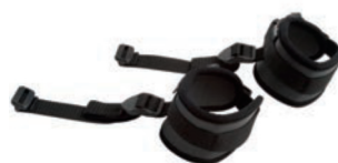
Par de bandas de tobillos