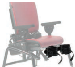
Soporte de piernas