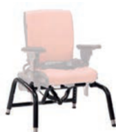
Base con basculación