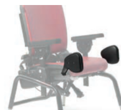
Par de adductores