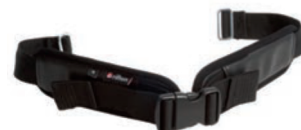
Cinturón de pierna