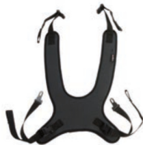
Peto de fijación estándar