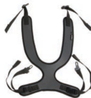
Peto de fijación estrecho