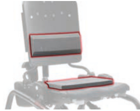
Kit soporte lumbar y asiento