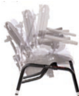
Base con basculación y asiento dinámico