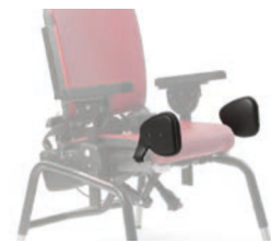
Par de adductores