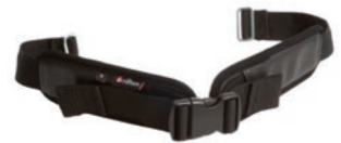
Cinturón de pierna