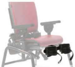
Soporte de piernas