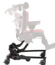
Base Hi-Lo con basculación y ruedas