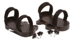
Par de sandalias