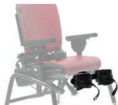
Soporte de piernas