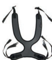
Peto de fijación estrecho