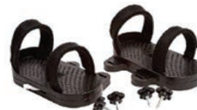
Par de sandalias