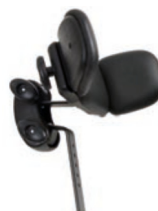
Reposacabezas con alas ajustables