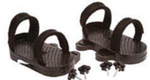
Par de sandalias