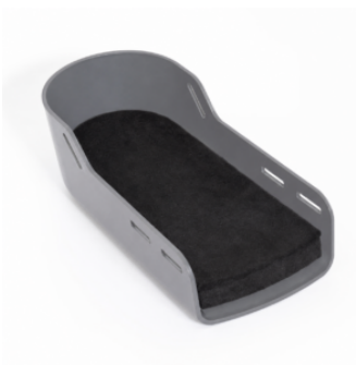
Bloc per sandàlia (20 mm)