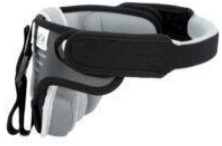
Headaloft a CAT I INVENTO