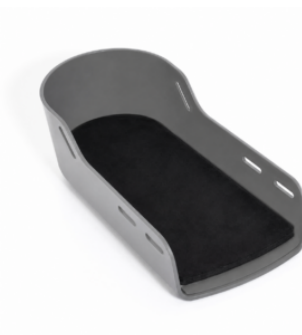
Bloque para sandalia (10 mm)