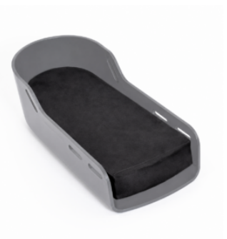
Bloque para sandalia (30 mm)