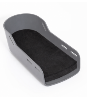
Bloque para sandalia (20 mm)