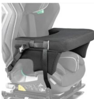
Taula Recaro Axion 1 Reha