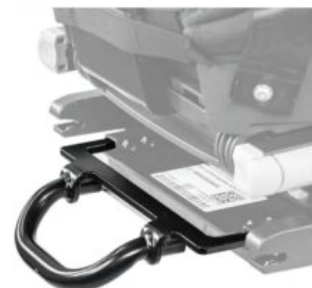
Arc estabilitzador Recaro Axion 1 Reha