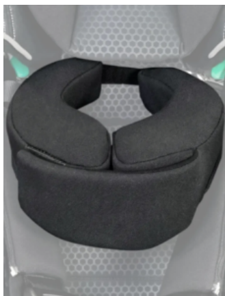
Suport de barbeta Recaro Axion 1 Reha