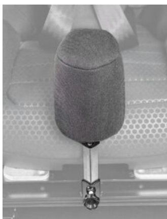
Tac abductor Recaro Axion 1 Reha