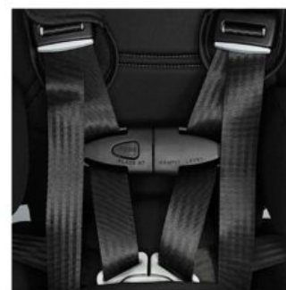
Tancament clip zona pit Recaro Axion 1 Reha