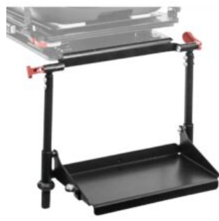
Reposapeus Recaro Axion 1 Reha