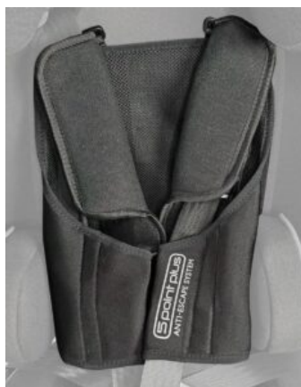
Armilla antiescapament Recaro Axion 1 Reha