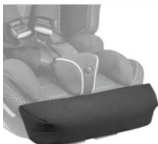
Ampliación de la profundidad del asiento Recaro Axion 1 Reha