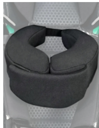
Soporte mentón Recaro Axion 1 Reha