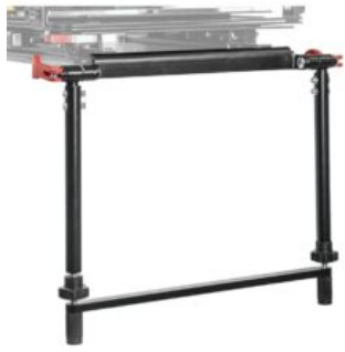
Estabilizador de suelo Recaro Axion 1 Reha