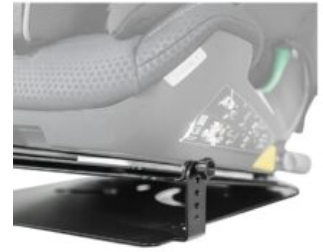
Base con basculación Recaro Axion 1 Reha