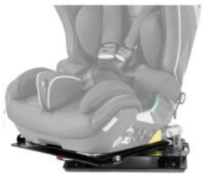
Base giratoria Recaro Axion 1 Reha