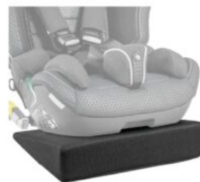
Cuña de asiento Recaro Axion 1 Reha