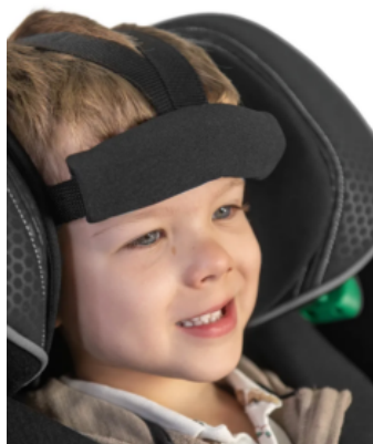
Soporte de frente Recaro Axion 1 Reha