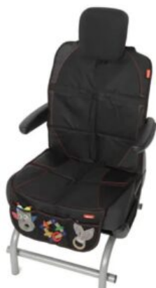
Alfombrilla protectora para asiento de coche Recaro Axion 1 Reha