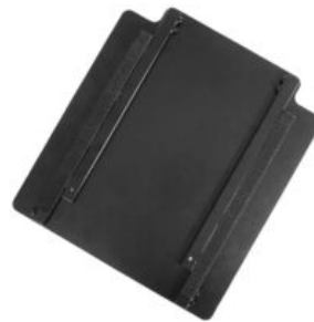
Adaptador de reposapiés Recaro Axion 1 Reha