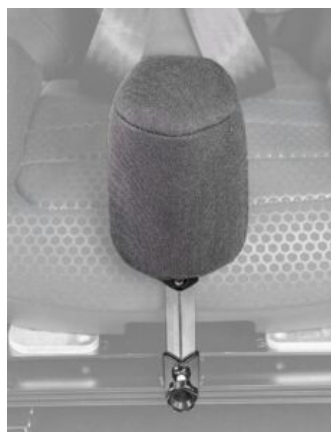
Taco abductor Recaro Axion 1 Reha