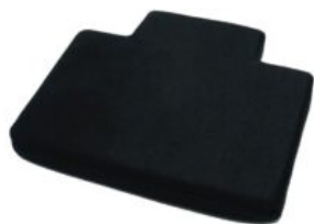
Cojín para base funcional Recaro Axion 1 Reha