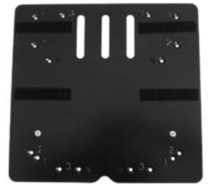
Placa adaptadora Recaro Axion 1 Reha