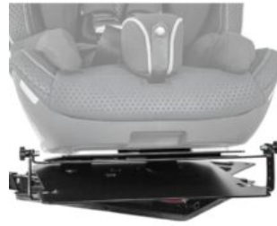
Base giratoria con basculación Recaro Axion 1 Reha