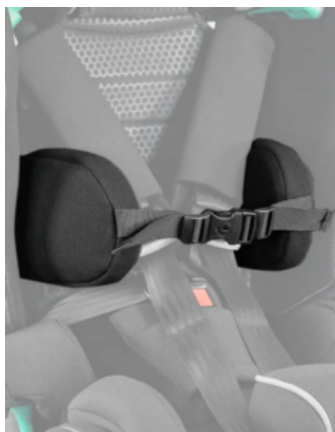
Soportes laterales de tronco para Recaro Axion 1 Reha