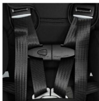
Cierre clip zona pecho Recaro Axion 1 Reha