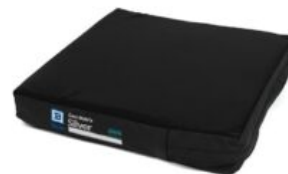
Funda exterior extra coixí Geo-Matrix™