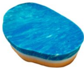
Inserto de espuma Geo-Matrix™