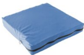
Funda interior extra cojín Geo-Matrix™