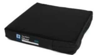
Funda exterior extra cojín Geo-Matrix™