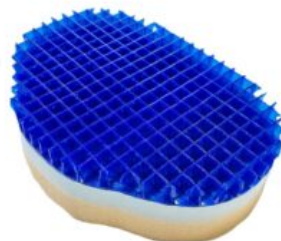
Inserto de gel Geo-Matrix™