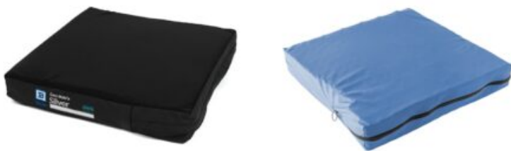
Funda exterior extra cojín Geo- Matrix™ Funda interior extra cojín Geo- Matrix™