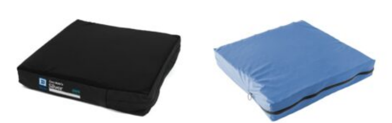
Funda exterior extra cojín Geo- Matrix™ Funda interior extra cojín Geo- Matrix™