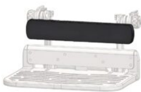
Placa de pantorrilla para reposapiés regulable Maxi