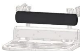
Placa de pantorrilla para reposapiés regulable Maxi