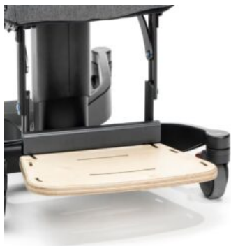
Reposapiés regulable en altura, ángulo y plegable Maxi