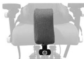
Taco abductor Maxi