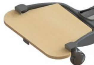
Plataforma de reposapiés extraíble Maxi