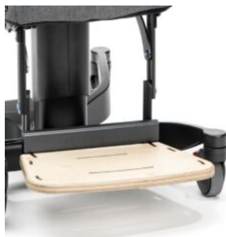
Reposapiés regulable en altura, ángulo y plegable Maxi