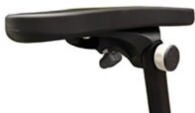
Reposabrazos: incluye inserción para mesa terapéutica de madera Maxi