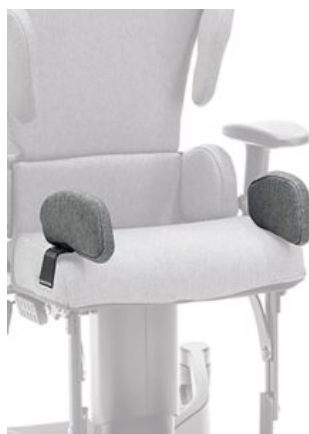
Soportes laterales de cadera Maxi