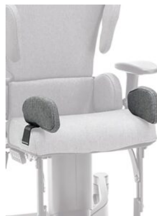
Soportes laterales de cadera Maxi