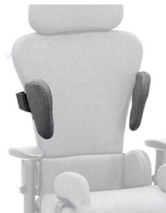
Soportes laterales de tronco Maxi