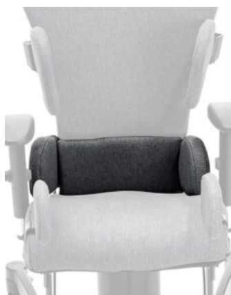
Soporte pélvico ajustable Maxi