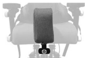
Taco abductor Maxi