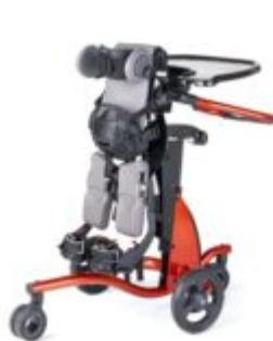
Vermell (talla 1)