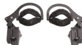
Genolleres giratòries Rifton Stander