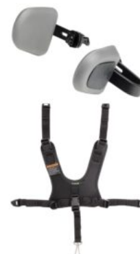
Extensió per a ús en posició supina Rifton Stander (opcions extres)