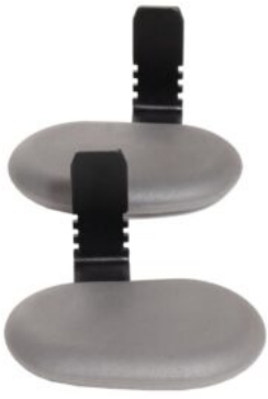
Suports per a la zona interior o exterior de la cuixa Rifton Stander