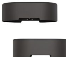
Kit d'elevació de sandàlies Rifton Stander