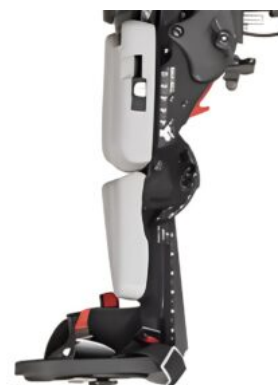
Reposacames avançat Rifton Stander