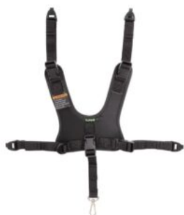
Peto de fixació Rifton Stander