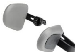
Laterals del cap Rifton Stander