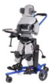
Blau (talla 2 i talla 3)