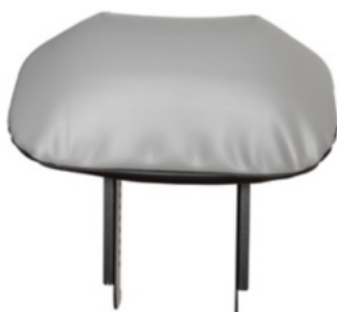
Suport de tronc en Prono (només per talla 3)