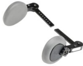
Controls laterals de tronc addicionals Rifton Stander