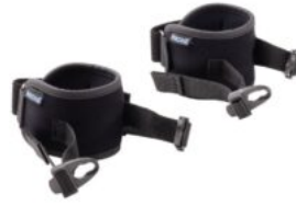
Suport de genolls Rifton Stander