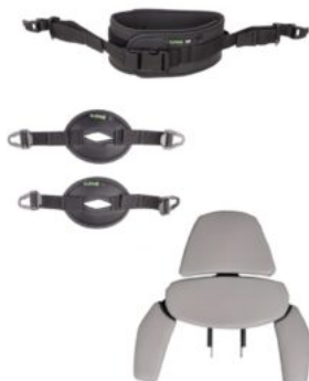
Extensió per a ús en posició supina Rifton Stander (opcions obligatòries)