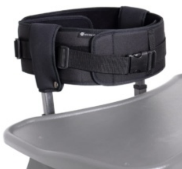
Control de pit Astride Pro Max