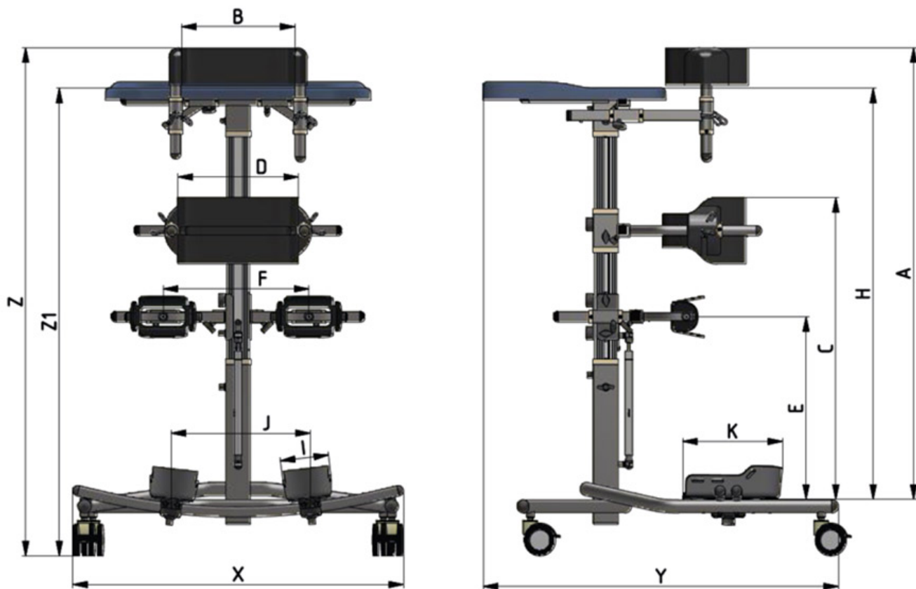
QUADRE DE MIDES (longitud en cm i pes en kg)