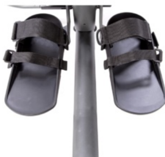
Cinchas de seguridad para soportes de pie Evolv y Glider