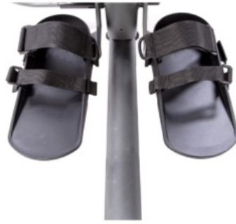
Cinchas de seguridad para soportes de pie Evolv y Glider