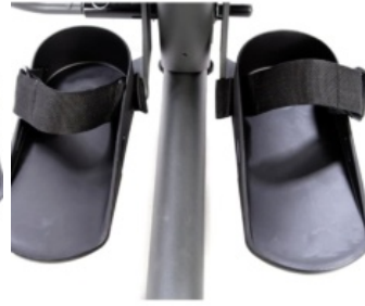
Cinchas para soportes de pie Evolv y Glider