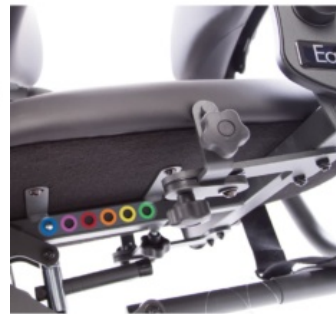
Ajuste fácil de profundidad de asiento Easy Stand