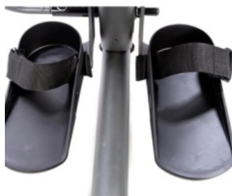
Cinchas para soportes de pie Evolv y Glider