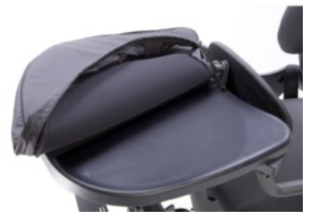
Funda higiénica acolchada para bandeja Bantam y Evolv