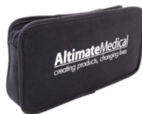
Bolsa de herramientas EasyStand