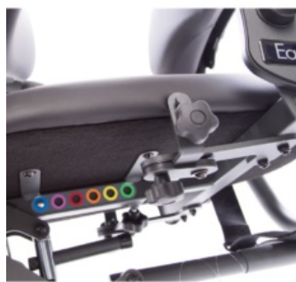
Ajuste fácil de profundidad de asiento Easy Stand