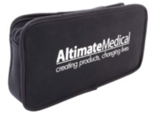
Bolsa de herramientas EasyStand