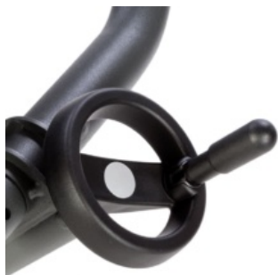
Rueda de ajuste de ángulo de respaldo Evolv y Glider