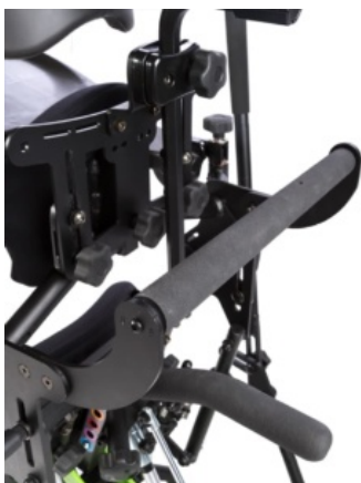
Asas de empuje EasyStand