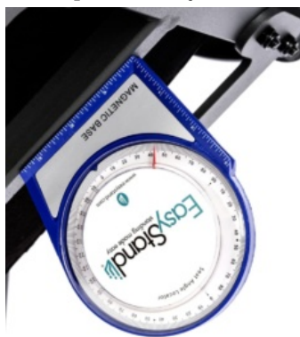
Identificador de ángulo EasyStand