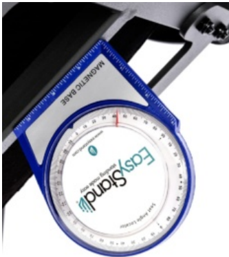
Identificador de ángulo EasyStand