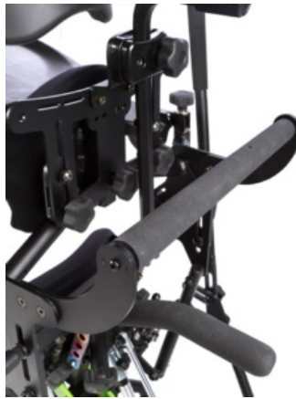
Asas de empuje EasyStand