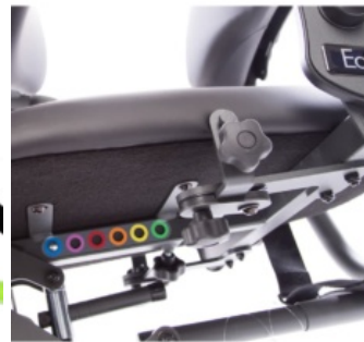
Ajuste fácil de profundidad de asiento Easy Stand