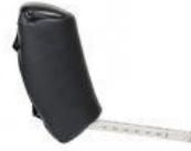
Abductor nuevo triciclo Rifton