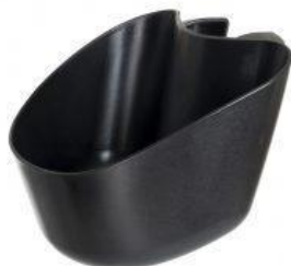
Cesta delantera triciclo Rifton