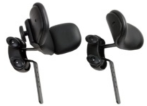
Reposacabezas triciclo Rifton