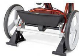
Soporte estacionario nuevo triciclo Rifton