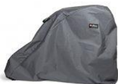
Funda para exterior nuevo triciclo Rifton