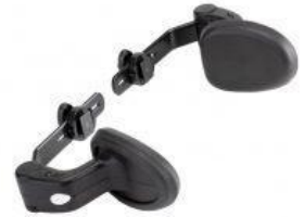
Soportes laterales de tronco nuevo triciclo Rifton