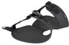
Arnés pélvico nuevo triciclo Rifton