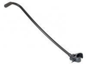
Barra de guía delantera triciclo Rifton