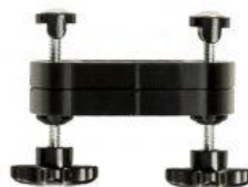
Kit de elevación de pedales triciclo Rifton