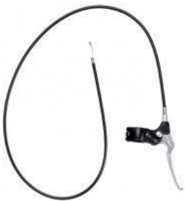
Freno de mano frontal nuevo triciclo Rifton