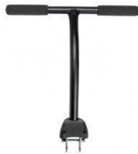
Barras de empuje o dirección nuevo triciclo Rifton