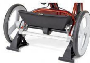
Soporte estacionario triciclo Rifton