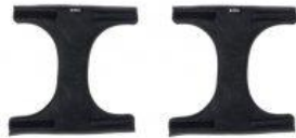
Anclajes de mano nuevo triciclo Rifton