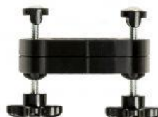
Kit de elevación de pedales nuevo triciclo Rifton