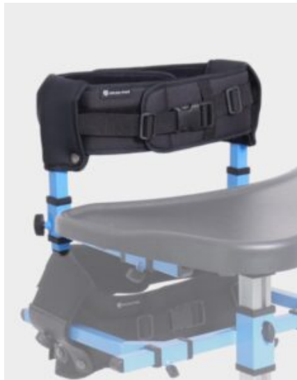
Control de pecho Astride Pro