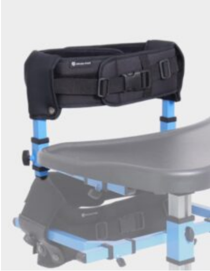
Control de pecho Astride Pro