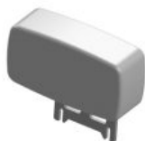
Reposacaps pla Standz