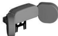
Suport d'espatlles amb protectors d'espatlla Standz