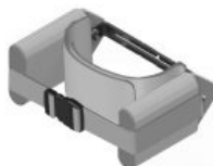
Suports pèlvics Standz