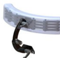
Reposacaps multiajustable 2 links Standz