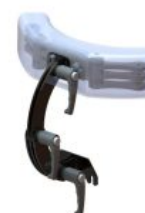
Reposacaps multiajustable 1 link Standz