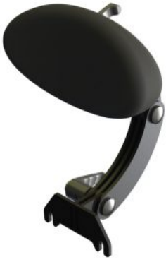
Reposacaps oval Standz