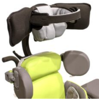
Headloft a Standz