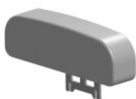
Suport pla d'espatlles Standz