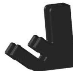
Penjador per a la taula Standz