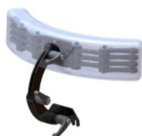
Reposacaps multiajustable 3 links Standz