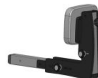
Controls pèlvics addicionals Standz