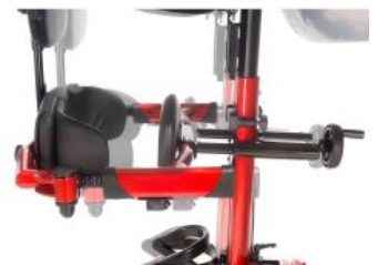
Posicionador pélvico Tim