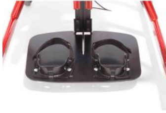
Cinchas de tobillo Tim