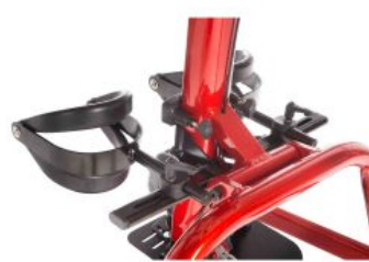
Soportes de rodilla Tim