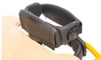
Soporte de pecho Tim