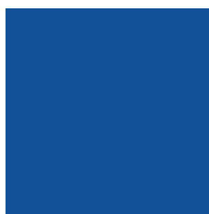
Azul metálico T3