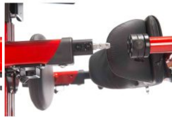
Soporte pélvico Tim