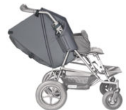
Extensión protector lateral RehaTom4