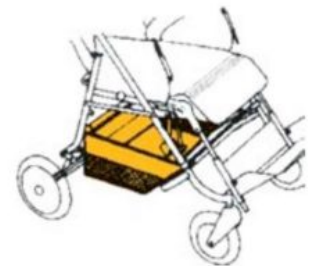
Cesta de tela RehaTom4