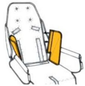
Soportes laterales RehaTom4