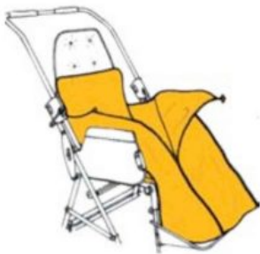
Saco de invierno RehaTom4