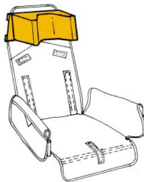
Reposacabezas en forma de «U» RehaTom4