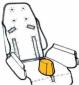
Taco abductor RehaTom4