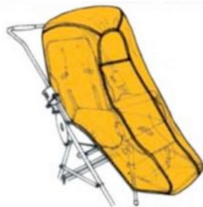
Capa impermeable (sólo con capota) RehaTom4