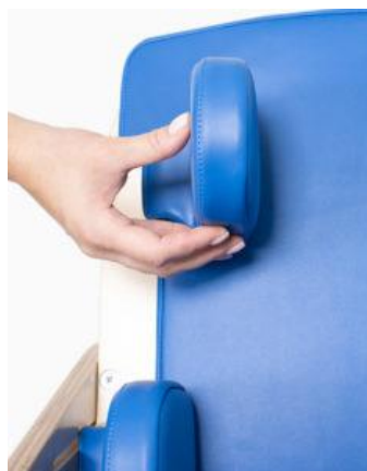
Soportes de pelvis Jumbo