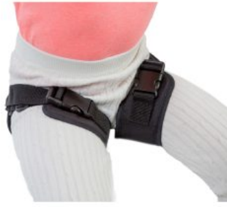
Cinturón de abducción de piernas Jumbo