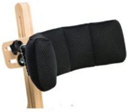
Reposacabezas ajustable Jumbo