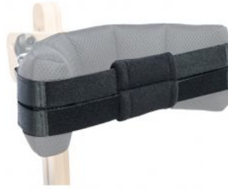
Cincha fijación Cabeza Jumbo