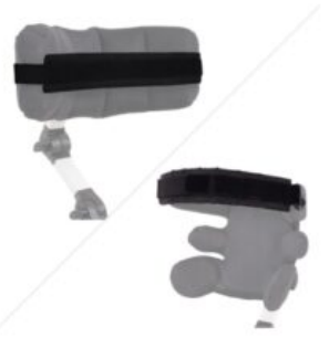
Cincha fijación Cabeza Jumbo