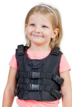
Chaleco 6 puntos Akces-Med