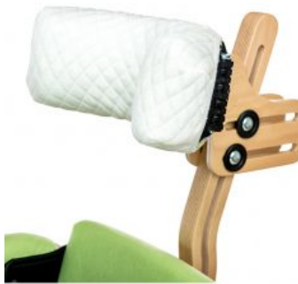
Funda reposacabezas Jumbo