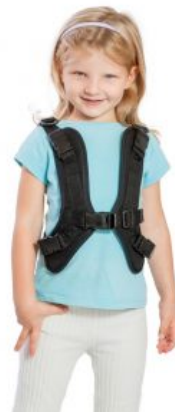
Arnés forma H Jumbo