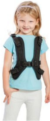
Arnés forma H Jumbo