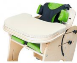
Funda para bandeja Jumbo