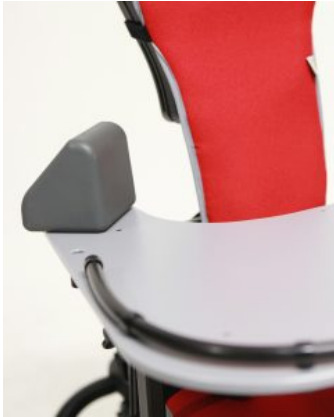
Bloques para codos (PAR) Junior / multiseat