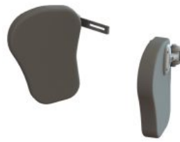
Soportes de hombro Jenx