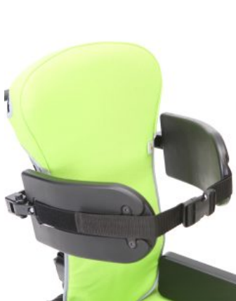
Soportes torácicos Multiseat