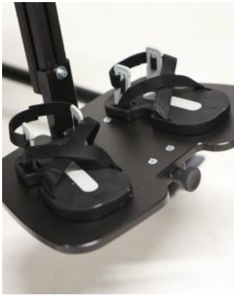
Sandalias Jenx (PAR)