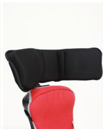
Reposacabezas multiajustable Junior+ / multiseat