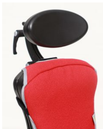
Reposacabezas oval Junior / Multiseat