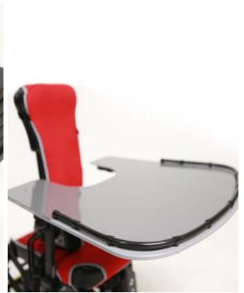
Mesa Junior+ / Multiseat