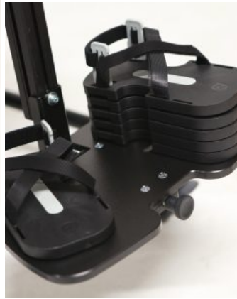
Bloques para una sandalia Jenx