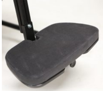
Plataforma reposapiés acolchada Multiseat