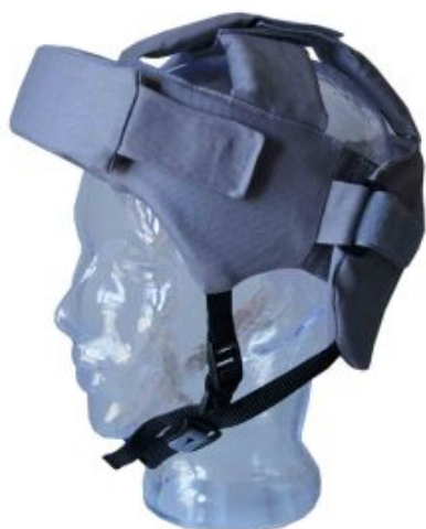
Protector frontal Capovario Soft