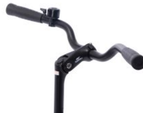
Manillar estándar triciclo Momo