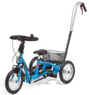
Barra de empuje triciclo Momo