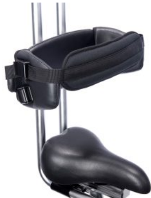
Cinturón de pecho triciclo Momo