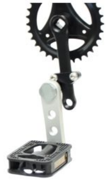
Biela pedal especial triciclo Momo