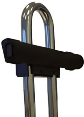
Barra universal para fijaciones triciclo Momo