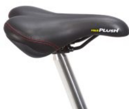
Sillín estándar triciclo Momo