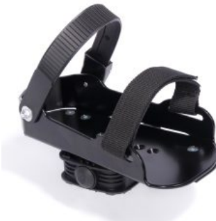
Pedales tipo sandalia triciclo Momo