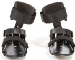
Pedales dinámicos de tobillo triciclo Momo