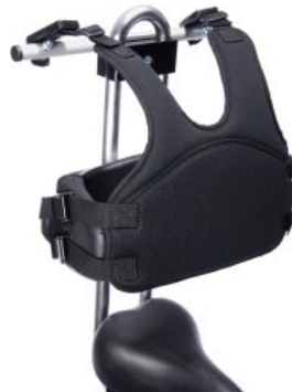
Chaleco de fijación triciclo Momo