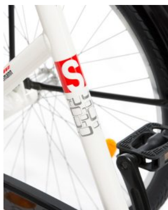
Impulsión Triciclo Momo