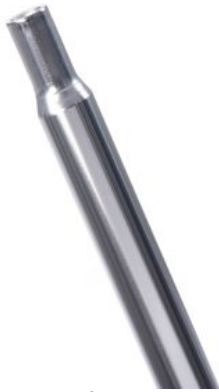
Soporte de sillín triciclo Momo