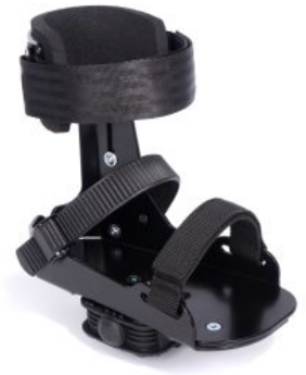
Pedales con soporte de tobillo triciclo Momo