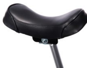
Sillín banana triciclo Momo