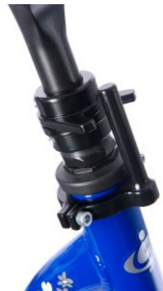
Limitador de dirección triciclo Momo