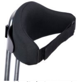
Respaldo dinámico con cincha triciclo Momo