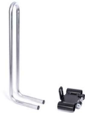
Barra de respaldo triciclo Momo