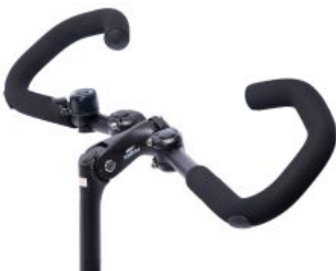
Manillar multiarticulado triciclo Momo