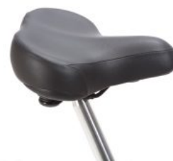
Sillín ciclomotor triciclo Momo