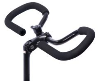
Manillar anatómico triciclo Momo