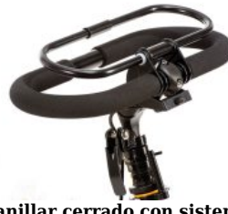
Manillar cerrado con sistema de freno triciclo Momo