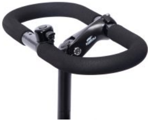
Manillar cerrado triciclo Momo