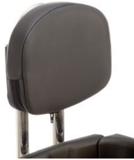
Reposacabezas triciclo Momo