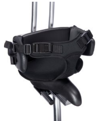
Fijación pélvica triciclo Momo