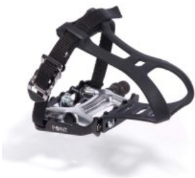
Pedal tipo ciclismo triciclo Momo