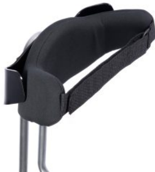
Control pélvico dinámico triciclo Momo