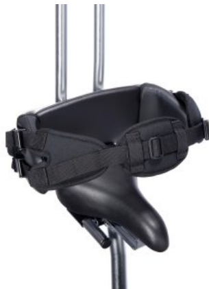
Cinturón 4 puntos triciclo Momo