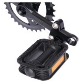
Reductor bielas pedales ajustable triciclo Momo