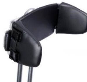
Control pélvico ajustable triciclo Momo