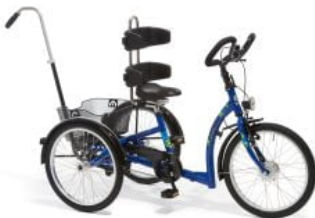
Barra de dirección triciclo Momo