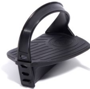
Pedales con fijación triciclo Momo