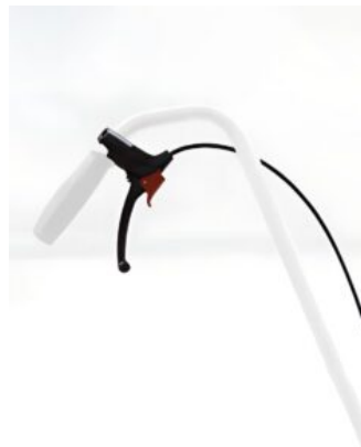
Freno barra de empuje triciclo Momo