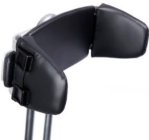
Respaldo ajustable en anchura triciclo Momo