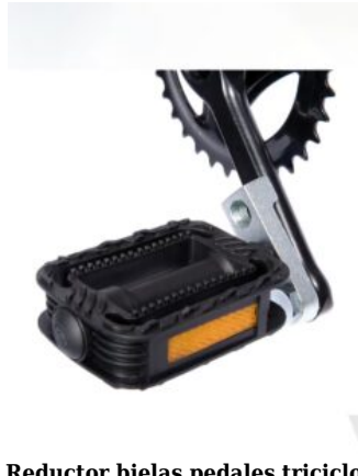
Reductor bielas pedales triciclo Momo