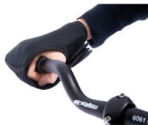
Fijación de mano triciclo Momo