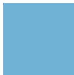
Azul pastel para tallas 20" y 24/20"