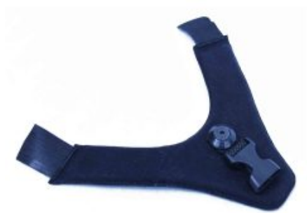
Cincha fijación Capovario *Required