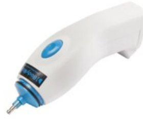
Bomba elèctrica Bodymap