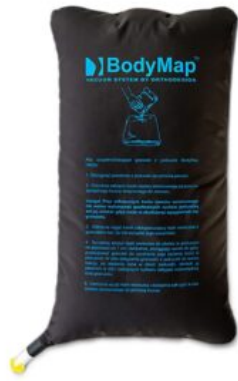
Bossa grànuls Bodymap