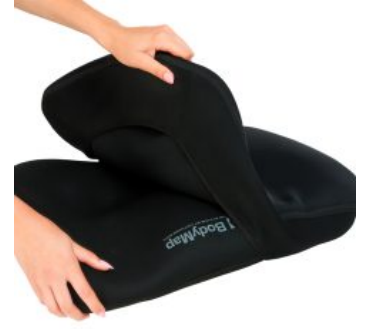
Funda Vismemo Bodymap