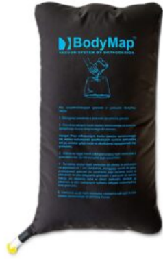
Bolsa gránulos Bodymap