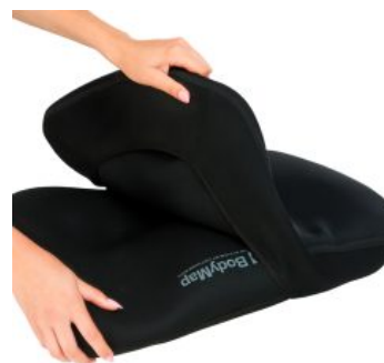
Funda Vismemo Bodymap