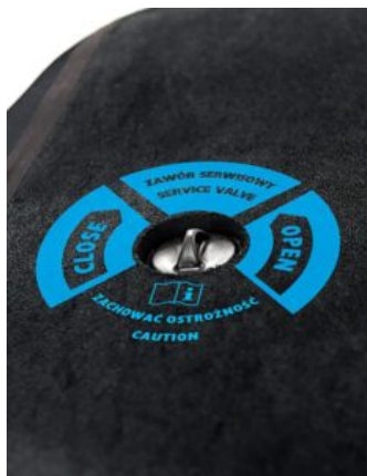
Válvula de acceso de gránulos para Bodymap