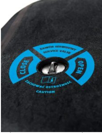
Válvula de acceso de gránulos para Bodymap