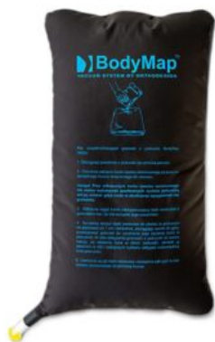
Bossa grànuls Bodymap