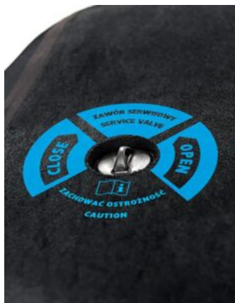
Válvula de acceso de gránulos para Bodymap