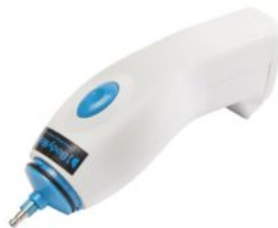
Bomba elèctrica Bodymap