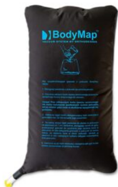
Bossa grànuls Bodymap