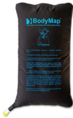
Bolsa gránulos Bodymap