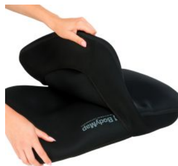
Funda Vismemo Bodymap