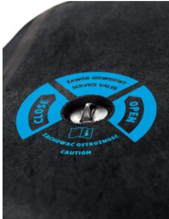
Válvula de acceso de gránulos para Bodymap