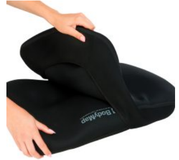
Funda Vismemo Bodymap