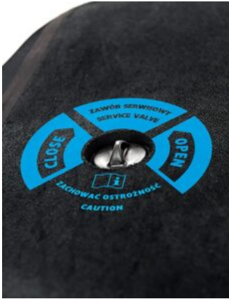
Válvula de acceso de gránulos para Bodymap