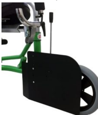
Guías de piernas (par) Meywalk 4