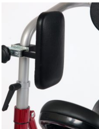
Soportes de cadera Meywalk 4